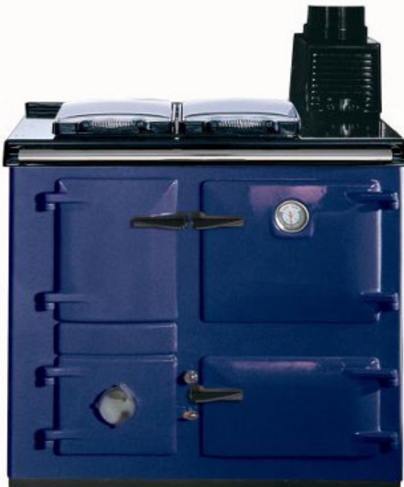
Bleu foncé « dark blue »