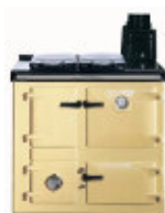
Crème « cream »