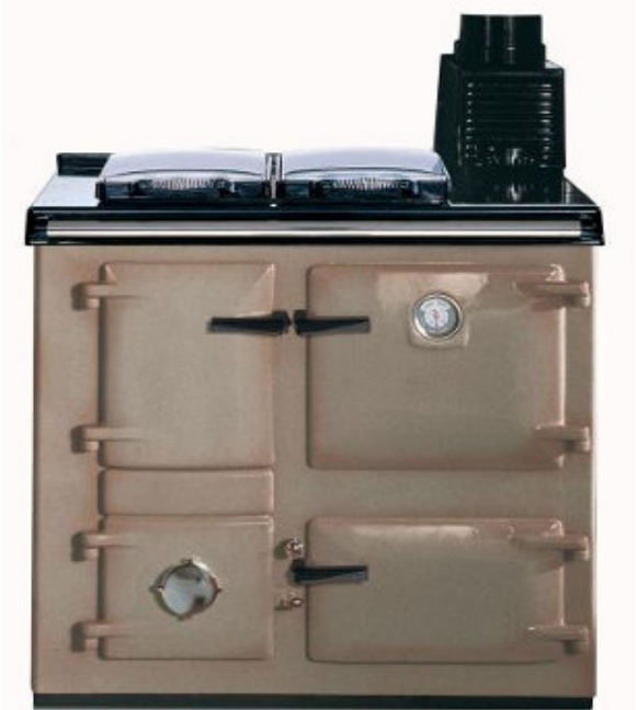
Sable « sable »