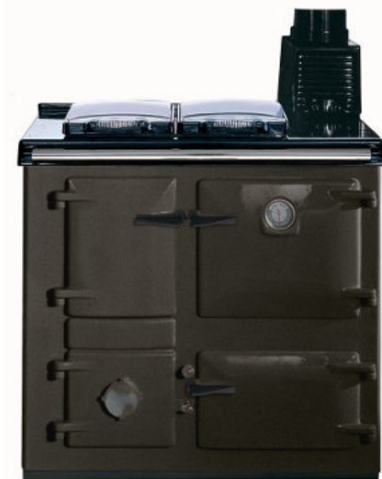
Etain « pewter »