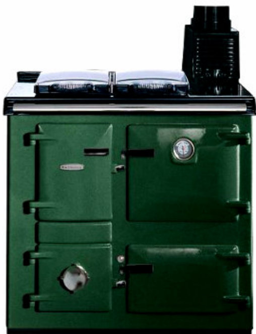
Vert foncé « racing green »