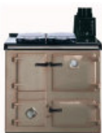
Sable « sable »

La façade et le plan de cuisson des cuisinières Rayburn sont fabriqués en fonte massive , recouverte de 3 couches d'émail vitrifié. Le dessus est toujours noir avec des couvercles chromés. La façade, quand à elle, se décline en 7 couleurs au choix .