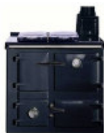
Noir « black »