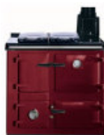
Bordeaux « claret »