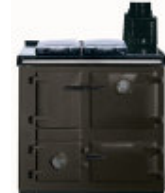
Etain « pewter »