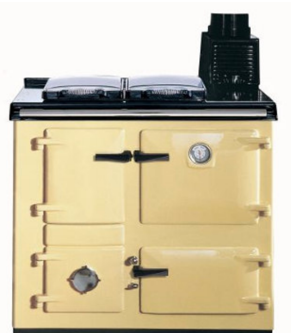
Crème « cream »