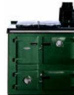
Vert foncé « racing green »