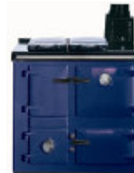
Bleu foncé « dark blue »