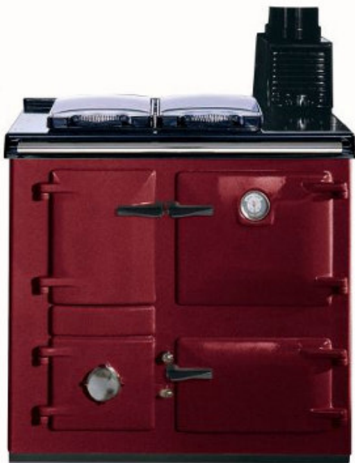
Bordeaux « claret »