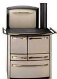
beige / laiton