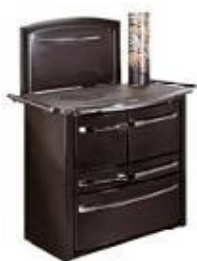
anthracite / chrome