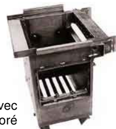
Foyer avec bouilleur incorporé