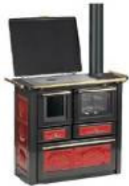
anthracite+bordeaux / laiton