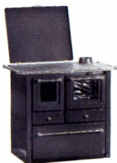
anthracite / chrome