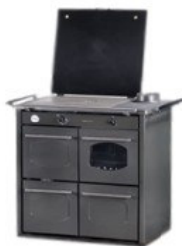
anthracite / chrome

* selon norme allemande (non testé EN12815)