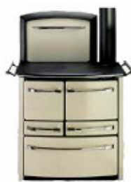
beige / chrome